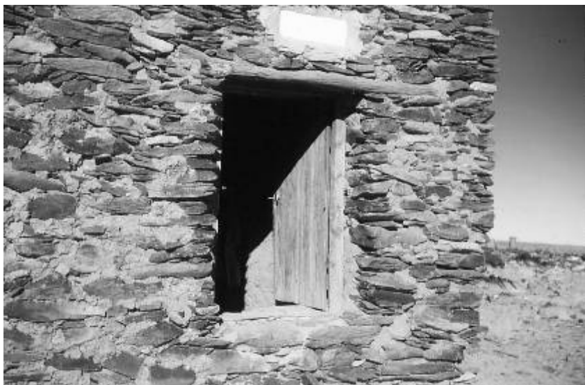
Ermita de El Assekrem del Hermano Carlos